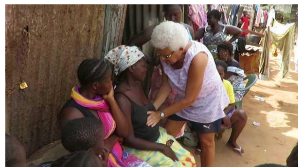
Overall voor de zieken gebeden