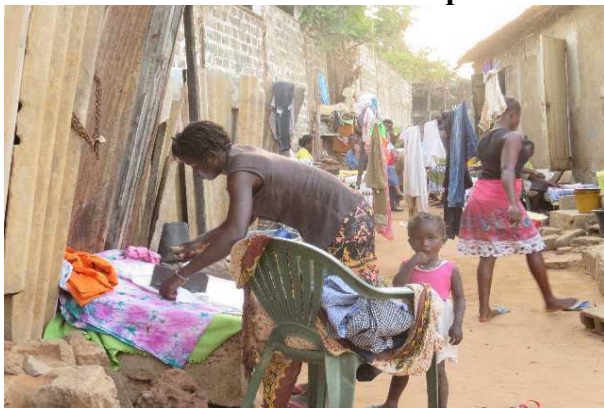
Strijken met kooltjes in een ijzer

Wij kunnen ons niet indenken hoe deze mensen elke dag opnieuw in deze moeilijke omstandigheden moeten overleven. God heeft ons duidelijk laten zien dat wij nog een taak hebben om hier in Gambia een ministry op te zetten. De Heer had al jaren geleden gesproken over een reizende bediening en dat is nu tot werkelijkheid gekomen. We zullen dit jaar waarschijnlijk nog twee keer naar Gambia gaan. In de toekomst gaan we er elk jaar 3 maanden heen, zo de Heer wil en wij leven. De plannen zijn dat wij in de zomer van 2021 naar Nederland terug gaan.