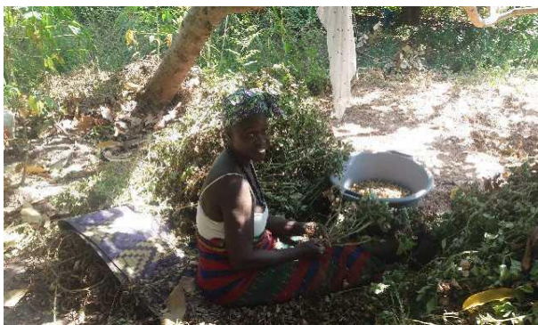
Pinda's oogsten in nederzetting