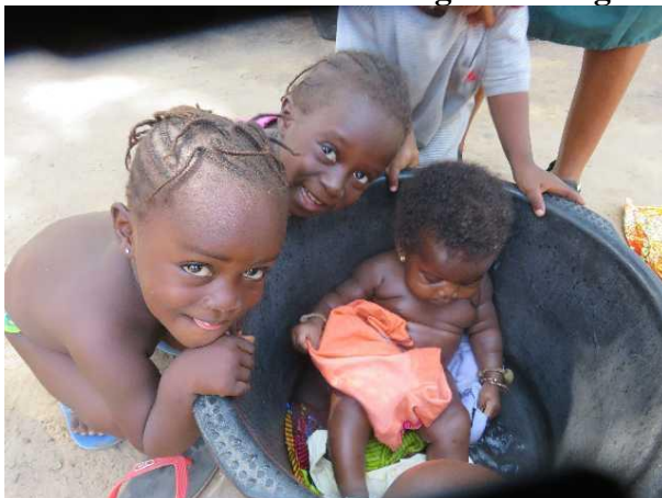
De kinderen worden meteen gewassen

Ondanks de armoede en de dagelijkse strijd tegen de honger en de zeer onhygiënische leefomstandigheden is er dankbaarheid, liefde en een alomvattende vrolijkheid in Gambia. Een rijkdom die de westerse mens niet kent. In dit land is 60% van de bevolking ondervoed. De mensen zijn heel vriendelijk en behulpzaam en verwachten niet dat je ze iets geeft, zoals wij dat gewend zijn in Zuid-Afrika. Er is bijna ook geen crime in Gambia. Het is er wel erg warm.