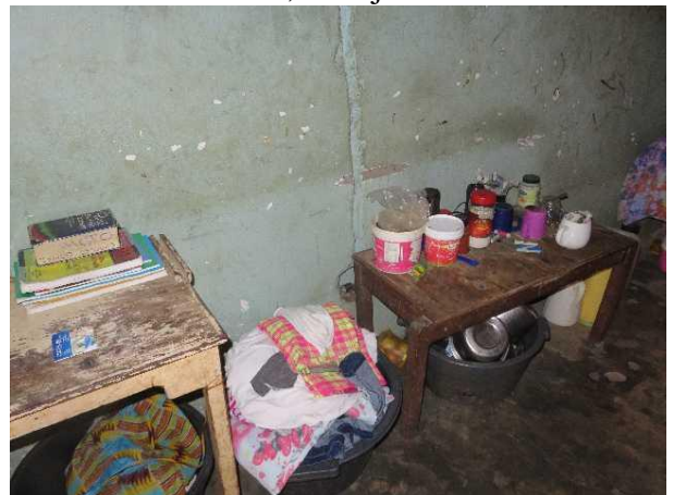
Dit zijn hun bezittingen

Op zulke matrassen slapen hele families dan samen in 1 kleine ruimte waar alleen nog een kleine plek is waar hun kookpotten kunnen staan. Ze leven eigenlijk altijd buiten. Maar er is in Gambia ook een lang regenseizoen, dus hoe ze dat dan doen, is mij een raadsel.