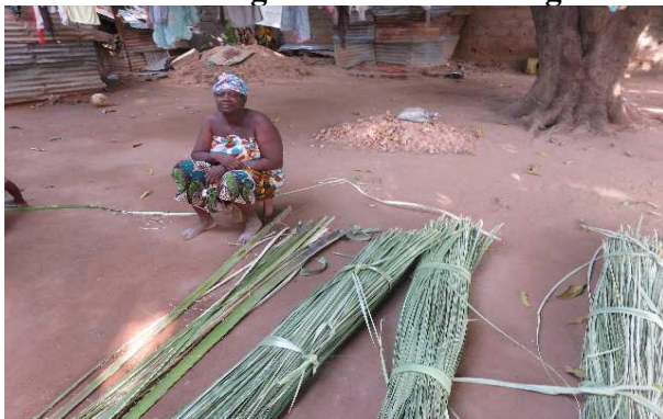
Manden maken van takken van palmbomen