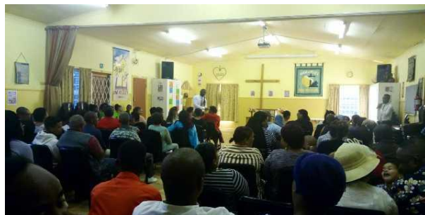
Telkens volle diensten in Oupad

Dit keer dat we weg waren, is alles piekfijn verlopen, alle programma's gingen gewoon door en alle 8 kerkdiensten in de week ook. En Moses neemt alles in Gambia waar, hij zal straks bij het gebouw gaan wonen. De Heer heeft ons hierin geweldig voorzien. Eind februari zal er nog een couple bij ons komen uit Leeuwarden, om te zien wat de Heer zegt tot hun, en wat de Heer zegt tot ons. Bidt daarvoor.