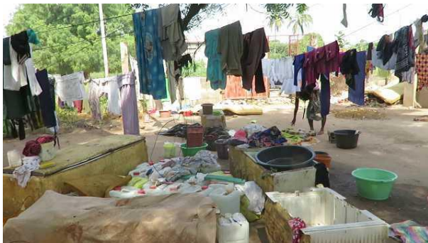
In de warmte is wel alles gauw droog.

Zo ziet de situaties eruit van mensen die in aanmerking zijn gekomen voor een voedselpakket. Hier wonen 9 mensen in die kleine ruimte en ze overleven van het wassen voor andere mensen, alles met koud water. Voor 1 wasbeurt ontvangen ze 50 dalasi dat is nog geen euro. De prijzen zijn ongeveer gelijk als in Nederland voor voedsel dus u begrijpt: ze leven zeer ver onder de armoedegrens.